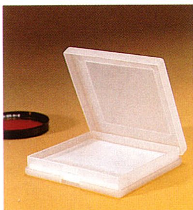
B+W Einzelfilterdose 1