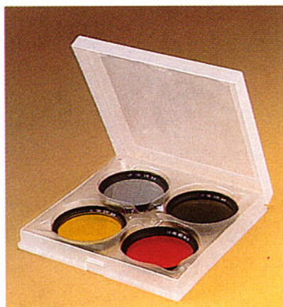
B+W Filterkassette 2