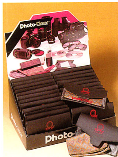
B+W Photo Clear 4