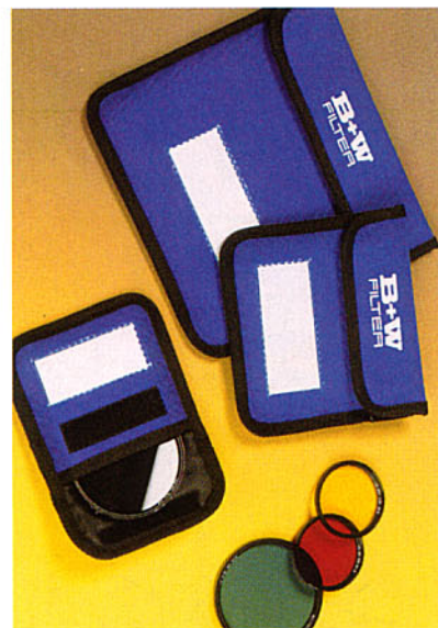
B+W Filteretuis 5