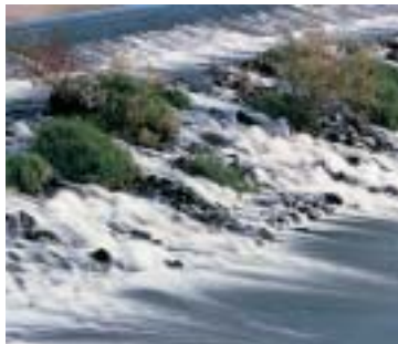
Con filtro 106 (gris) de densidad neutra

Los filtros de balance de la luz proporcionan una corrección del color más pura. Los filtros denominados "Correctores de color" permiten suavizar o acentuar el rendimiento de color de la película.