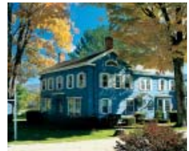
con filtro polarizador

ricos. En la fotografía de naturaleza un filtro polarizador produce un cielo azul intenso, blancas nubes resplandecientes y plantas de vívidos colores. Sus versátiles posibilidades se aplican tanto a la fotografía en B & N, a la fotografía en color o a la digital. Disponibilidad de dos variantes: filtro polarizador circular y polarizador lineal.