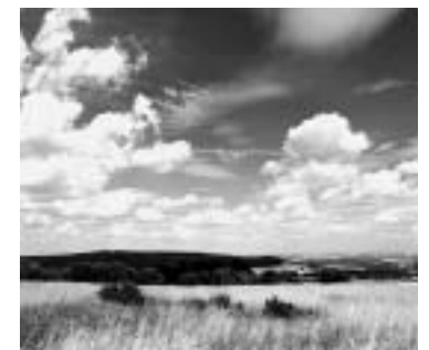
con filtro naranja 040