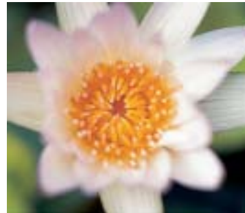
Con lente de aproximación NL4

En comparación, las lentes B+W de aproximación son de poco precio, no aumentan el tiempo de exposición y, como los filtros, son pequeños y de poco peso. Operan como un objetivo macro delante del objetivo normal, reduciendo la distancia focal sin variar su extensión, y aumentando la escala de reproducción disponible.