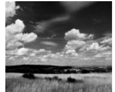
con filtro rojo 090