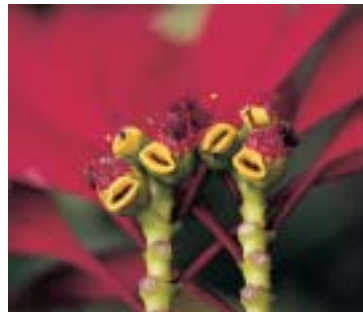
con lente de aproximación