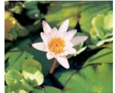
Sin lente de aproximación

La reproducción de objetos muy pequeños suele representar un problema para los objetivos normales, ya que, normalmente, éstos están diseñados para actuar de forma óptima en ajustes al infinito. Los objetivos normales para cámaras de 35mm sólo enfocan a partir de 40cm. Esto es suficiente para objetos del tamaño de una postal. Aproximaciones mayores pueden obtenerse usando objetivos macro o con anillos intermedios. Ninguna de ambas soluciones es económica, y ambas reducen la apertura efectiva, requieren exposiciones de más duración y a la vez ocupan mayor espacio en su bolsa de transporte.